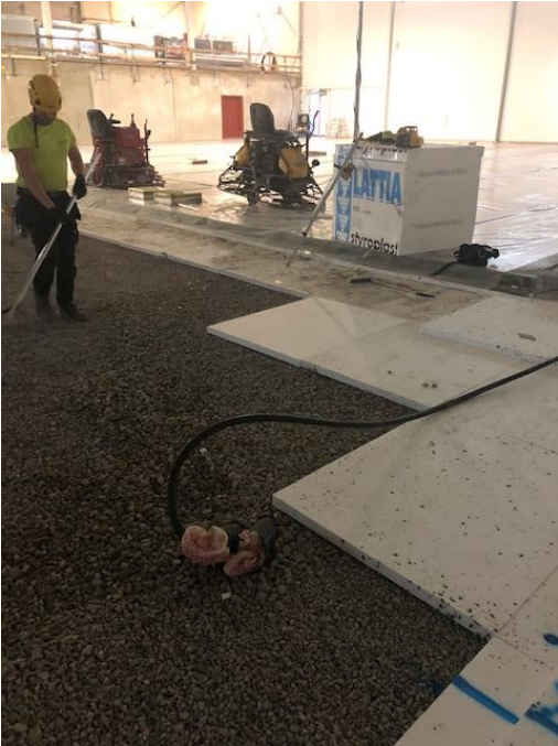
Lattiavaluvalmistelut käynnissä seuraavaa valukertaa varten.